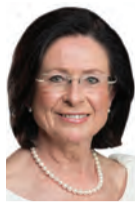
2 Miroslava Němcová 64 let, poslankyně Parlamentu ČR, Žďár nad Sázavou